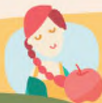
Vaše Organizátorka Míša

kde vás budeme pravidelně informovat o novinkách a zajímavostech ze Scuku.