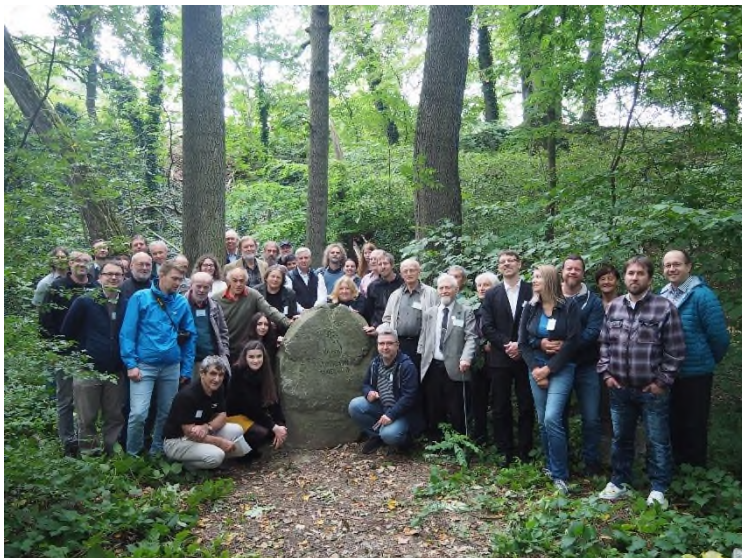
Účastníci konference v lesním kostele