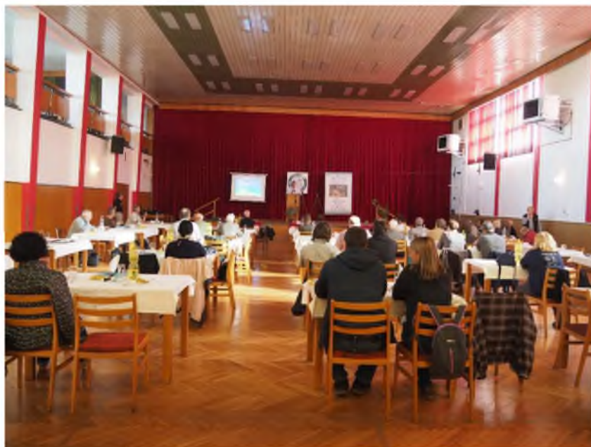
Pohled do sálu v Klubu kultury