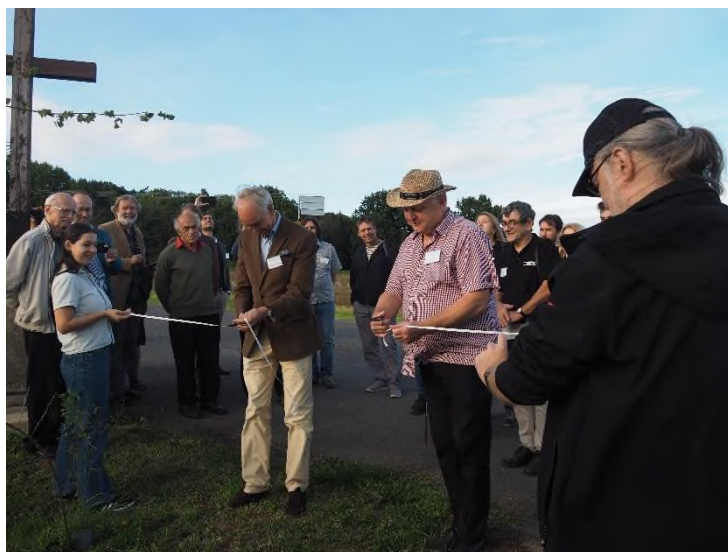
Slavnostní přestřižení pásky na Růžovém paloučku